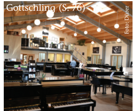
Gottschling (S. 76)